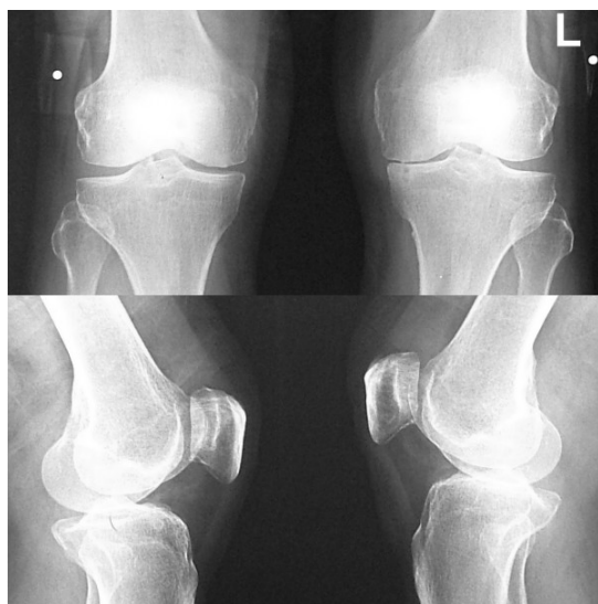
圖一：左膝 medial compartment OA change

助器協助活動，X-ray 明顯左膝 medial compartment OA change (圖一)，欲施行左膝內側關節置換手術；故依規定向全民健康保險局提出人工半膝關節組 MILLER/GALANTE UNICOMPARTMENTAL KNEE SYSTEM(FBKUA1000TZ1)之事前審查申請。